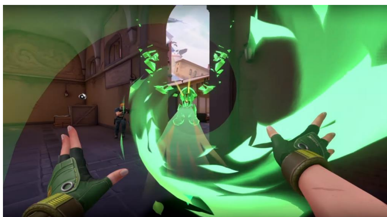
Figura 1: Personagem do jogo Valorant utilizando uma de suas habilidades

Tendo isso em mente, é notório que os jogos First Person Shooter não se tratam apenas de pressionar um botão no momento certo, mas, também, exigem que os jogadores desenvolvam uma mentalidade flexível que permite que eles se envolvam em cenários complexos, para reagir rapidamente a eventos visuais repentinos que estão em movimento e alternando entre diferentes subtarefas, além de utilizar habilidades (Figura 1) com o objetivo de tornar a competição mais complexa e trazendo um caráter fantasioso ao jogo, o que rompe um pouco com a ligação da realidade com os jogos FPS (COLZATO et al., 2010).